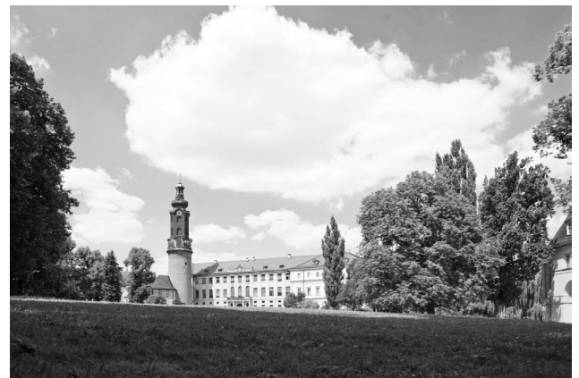
Abb. 3: Stadtschloss Weimar – Sitz der Goethe-Gesellschaft