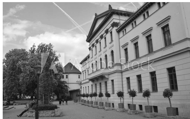
Abb. 2: Jugend- und Kulturzentrum mon ami am Goetheplatz in Weimar