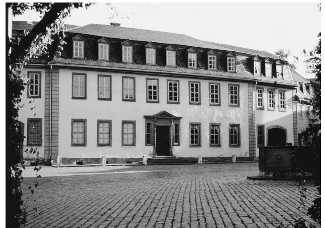
Abb. 4: Das Goethe-Nationalmuseum in Weimar